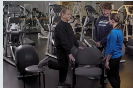
Estiramiento de los cuádriceps