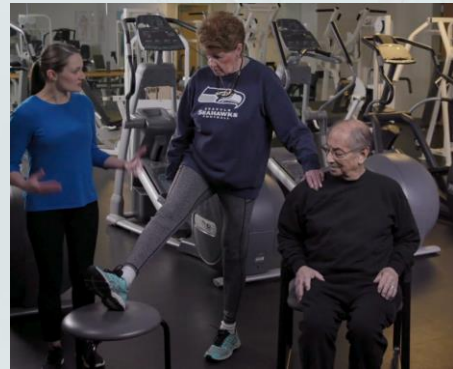
Estiramiento de los isquiotibiales

Estiramiento de los cuádriceps: flexione la rodilla y lleve el pie hacia atrás. Mantenga la pierna alineada con el cuerpo