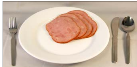
Mediana (6 onzas)