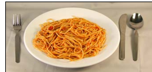
Grande (2 1/2 tazas)