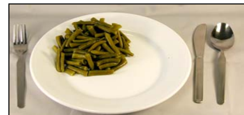
Grande (1 1/2 tazas)