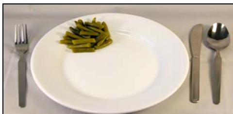
Pequeña (1/3 taza)