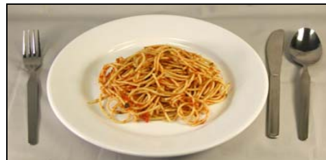
Mediana (1 1/2 tazas)