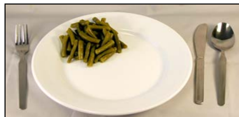
Mediana (3/4 taza)