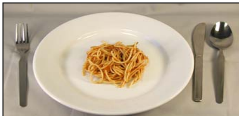
Pequeña (3/4 taza)