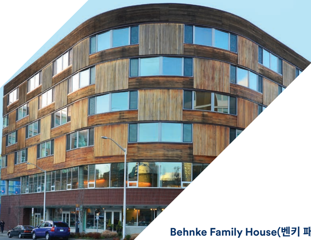
Behnke Family House(벤키 패밀리 하우스)