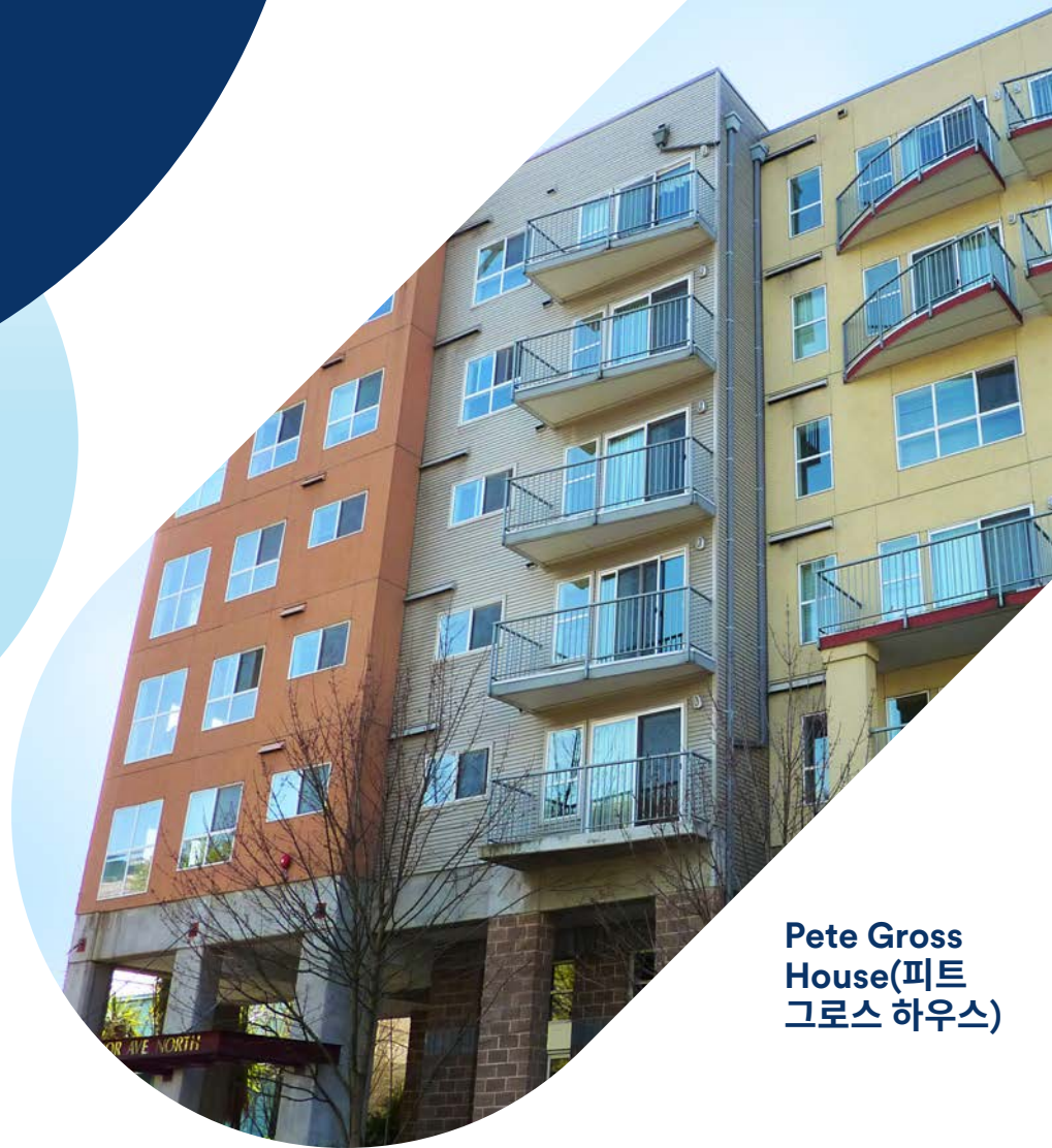
Pete Gross House(피트 그로스 하우스)