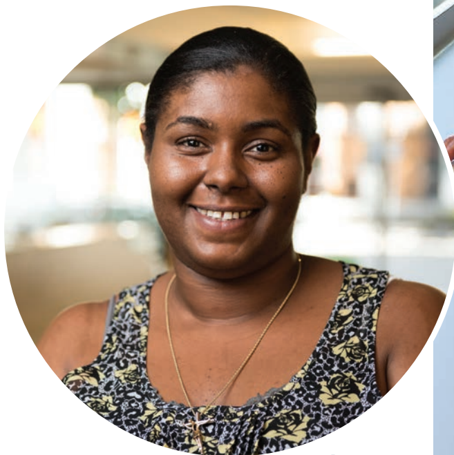
Kimiko J. Behnke Family House 工作人员

如果您对您的选择有任何疑问,请随时致电 (206) 606-7263 或发邮件至 lodging@fredhutch.org 联系我们。