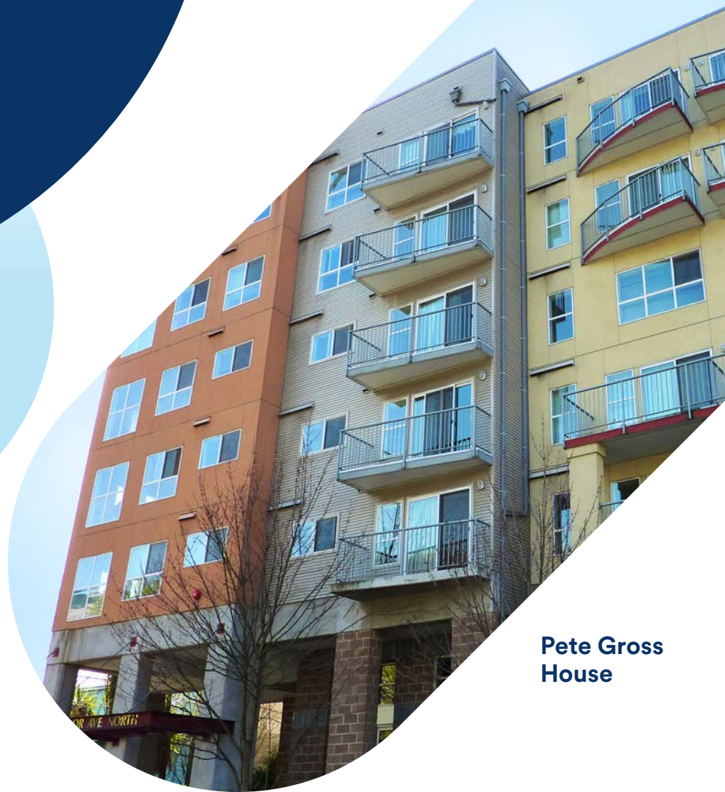
Pete Gross House