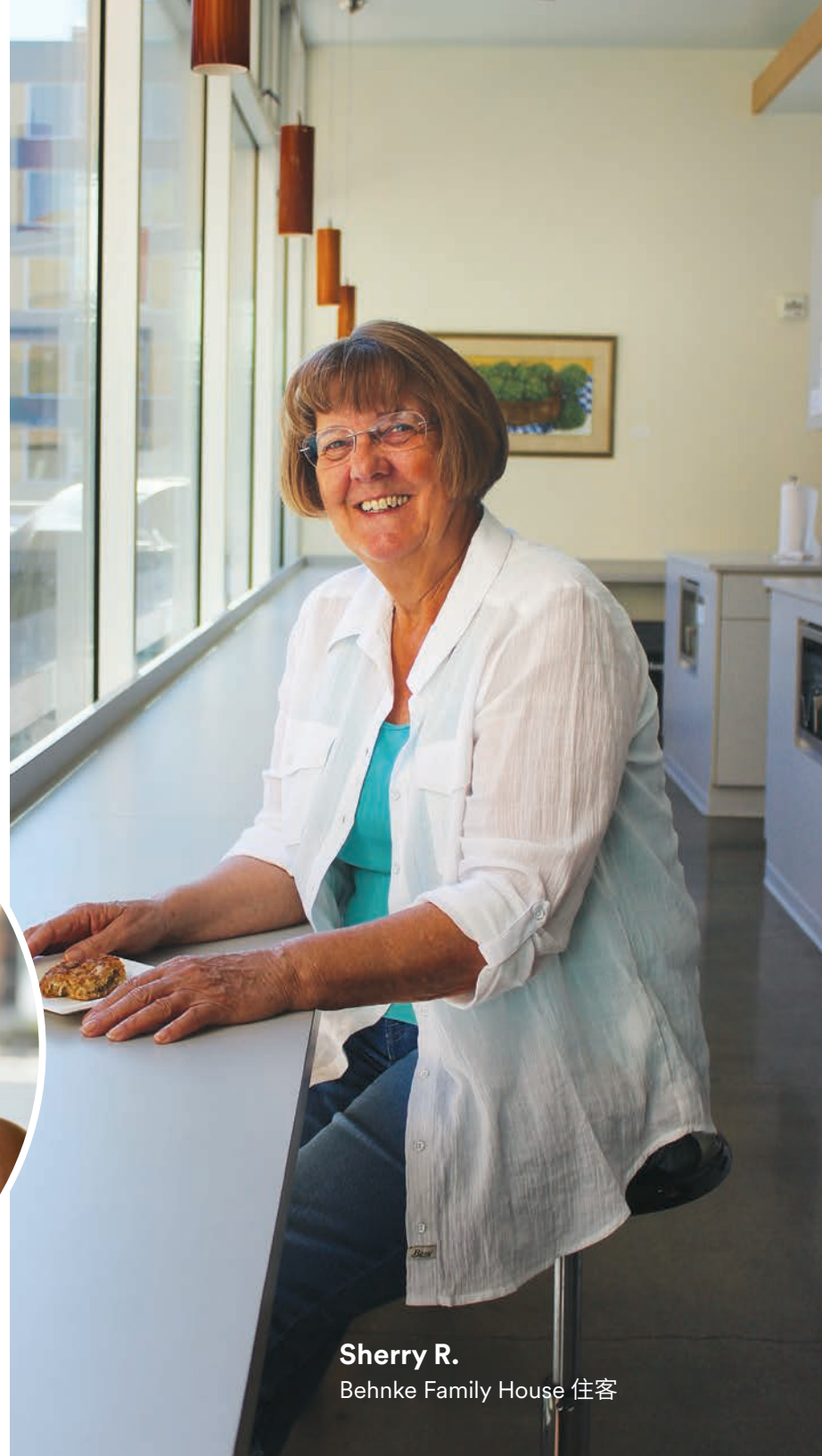
Sherry R. Behnke Family House 住客